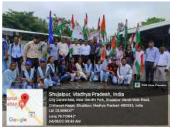
Participation in Har Ghar Tiranga Yatra on 4 th August 2022