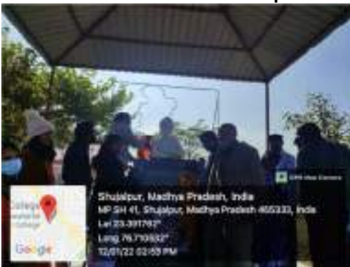
Swami Vivekanand Jayanti is celebrated every year on 12 th January in college with students & staff