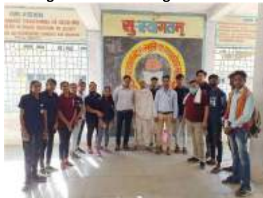
Gandhi Jayanti is celebrated every year on 2 nd October in college with students & staff