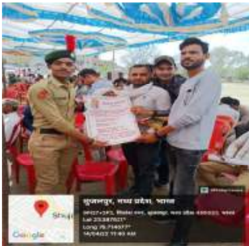
Dr. Ambedkar Jayanti celebrated on 14 th April 2022