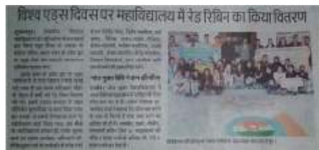
AIDS awareness program is organized on December 1 st every year