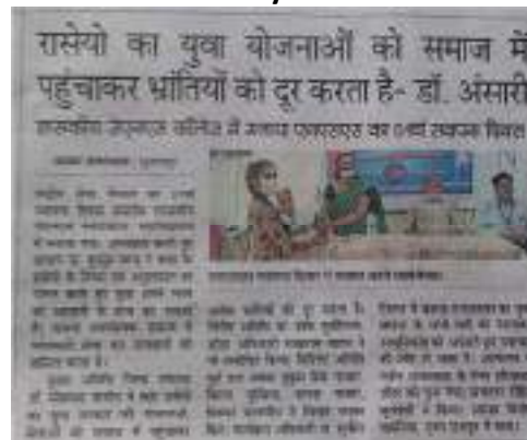
NSS Day celebration on 24 th September