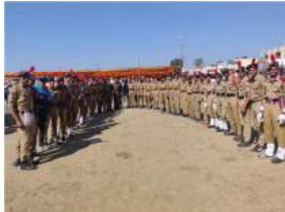
Celebration of Republic Day 26 th January 2020