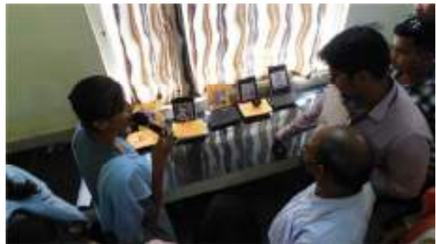
National Science Day celebration on 28 th February