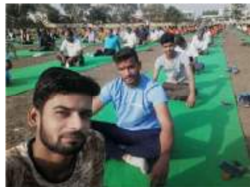
International Yoga Day celebrated on 21 st June each year