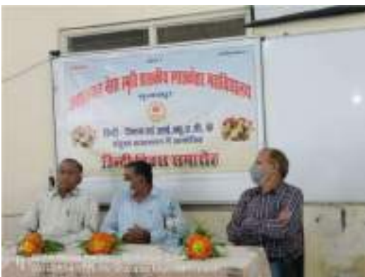
Hindi Diwas celebrated on 14 th September 2021