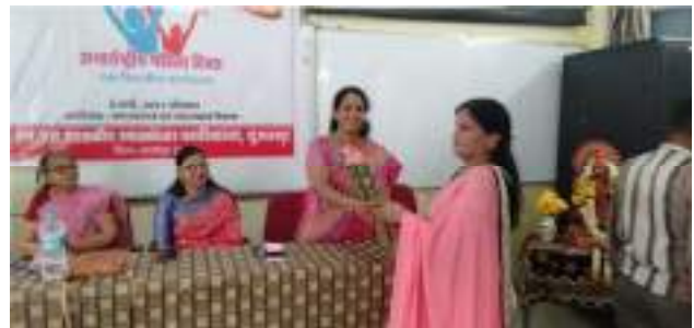
Women's Day celebration on 8 th March 2021