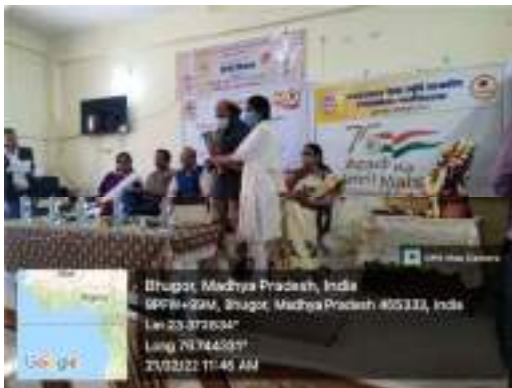
Celebration of International Mother Language Day on 21 st February 2022 to promote and preserve all languages