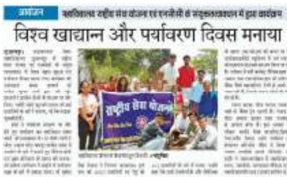
Celebration of World Food Day & Environment Day in College