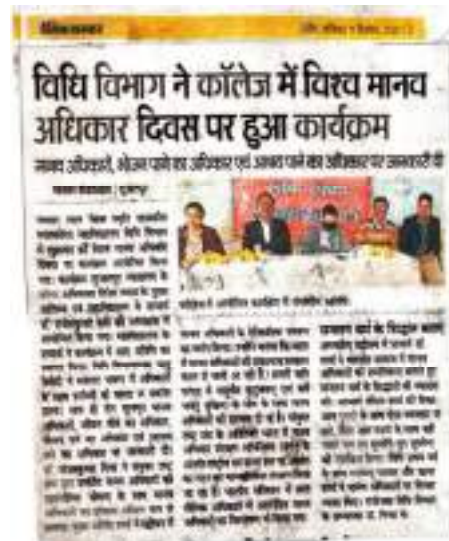
A program organized in honour of Human Rights Day on 10 th December