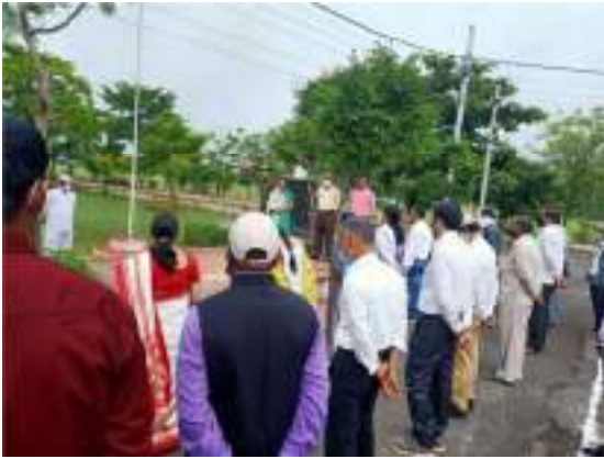
Celebration of Independence Day on 15 th August 2021