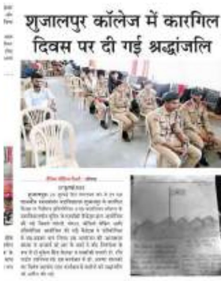
Kargil Vijay Diwas is celebrated each year on 26 th July in honour of our Kargil War Heroes