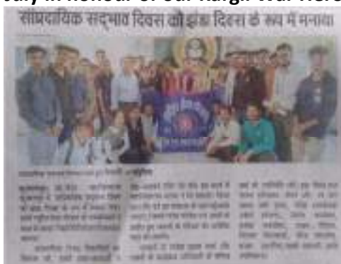
Communal Harmony Week and Flag day celebrated during 19 th to 25 th November