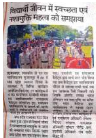
Madhya Pradesh Foundation Day celebrated on 1 st November each year