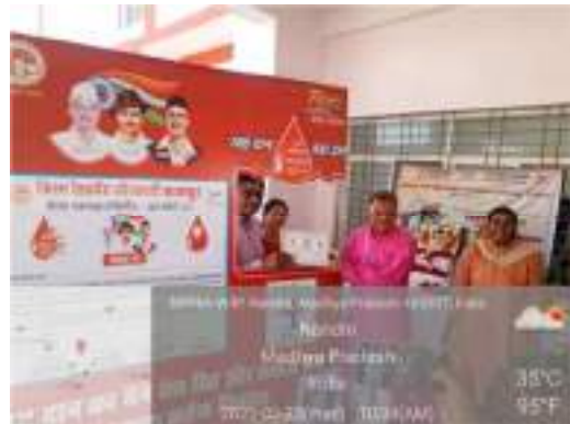
Shahid diwas (Martyr's Day) is commemorated each year on 23 rd March to remember the sacrifice of Bhagat Singh, Shivaram Rajguru and Sukhdev Thapar. College organizes Blood Donation Camp on this occasion with active involvement of Red Ribbon Club, NCC & NSS.