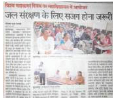
Celebration of World Ocean Day on 8 th June to spread awareness on significance of oceans in our civilization.