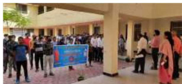
Oath ceremony at Vigilance Awareness Week